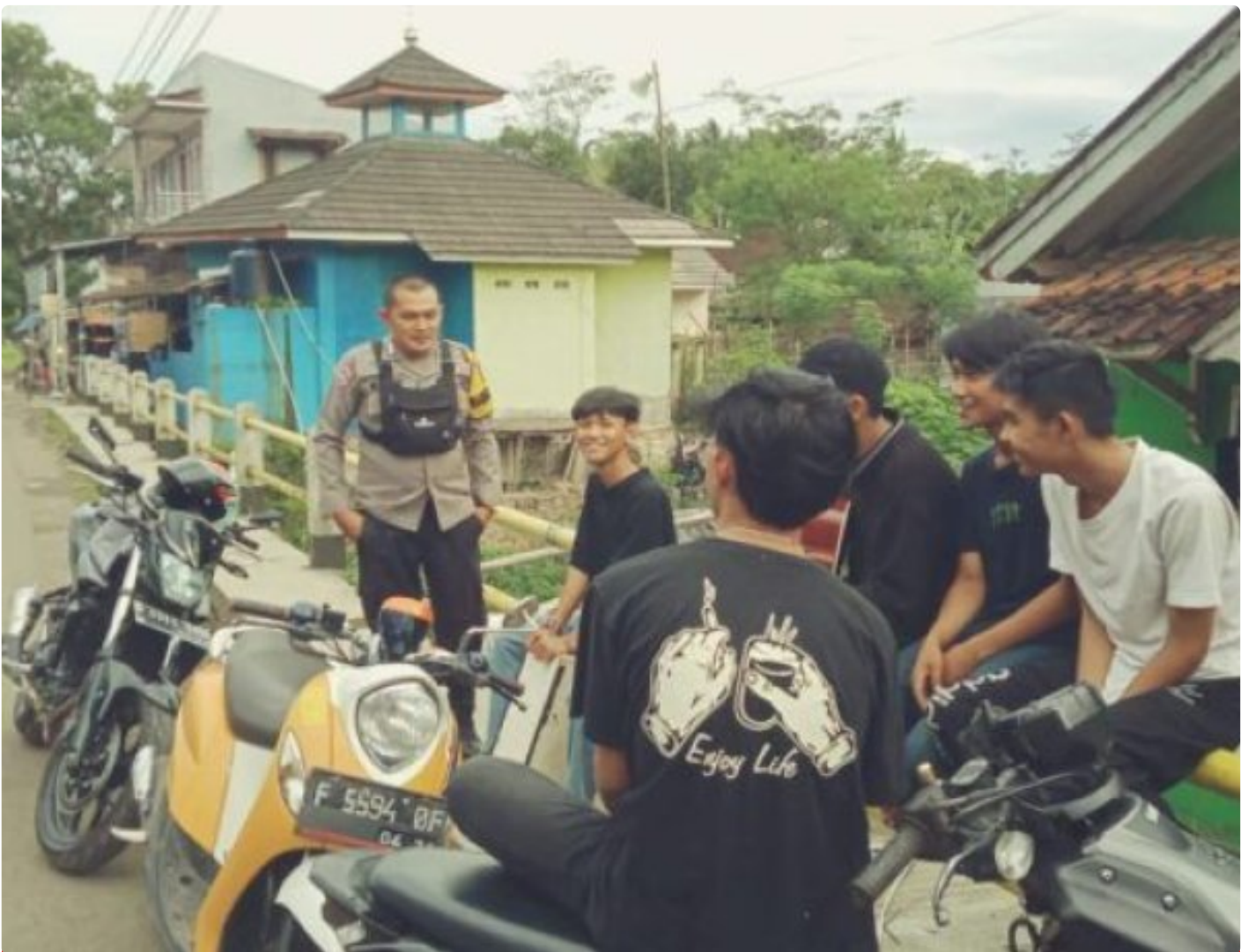
Polsek Cireunghas Polres Sukabumi Kota

Kota Sukabumi – Polres Sukabumi Kota Polda Jawa Barat – Polsek Cireunghas melaksanakan kegiatan dialogis dengan para pengemudi angkutan umum di jalan sempur, Selasa (30/1/24). Kegiatan ini bertujuan untuk menyampaikan himbauan kamtibmas kepada para pengemudi dan meningkatkan kerja sama antara